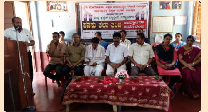
ರಂಗ ತಂಡದ ರಚನೆ ಮತ್ತು ಉದ್ಘಾಟನೆ

ಉಡುಪಿ ಜಿಲ್ಲೆಯ ಬೈಲೂರು, ತಲ್ಲೂರು ಕ್ಲಸ್ಟರ್ ಮತ್ತು ದ.ಕ ಜಿಲ್ಲೆಯ ಮದ್ದು, ಉಜಿರೆ, ಹಾರಾಡಿ ಮತ್ತು ಆಲೆಟ್ಟಿ ಕ್ಲಸ್ಟರ್‌ನಲ್ಲಿ 6 ರಂಗ ತಂಡಗಳ ರಚನೆಯನ್ನು ಆಯಾ ತಾಲೂಕಿನ ಶಿಕ್ಷಣ ಸಂಪನ್ಮೂಲ ಕೇಂದ್ರಗಳ ಸಹಕಾರದೊಂದಿಗೆ ಮಗುಸ್ನೇಹಿ ಪರಿಕಲ್ಪನೆಯ ಶಾಲೆಗಳ ಮಕ್ಕಳನ್ನು ವಿವಿಧ ಮಾನದಂಡ ಮತ್ತು ಪ್ರಾತಿನಿಧ್ಯಗಳನುಸಾರವಾಗಿ ಹೆತ್ತವರ ಅನುಮತಿಯೊಂದಿಗೆ ಕ್ಲಸ್ಟರ್ ಮಟ್ಟದಲ್ಲಿ 25 ರಿಂದ 30 ಮಕ್ಕಳನ್ನೊಳಗೊಂಡ ಮಕ್ಕಳ ಹಕ್ಕುಗಳ ರಂಗ ತಂಡವನ್ನು ನವೆಂಬರ್ ತಿಂಗಳಲ್ಲಿ ರಚಿಸಲಾಯಿತು.