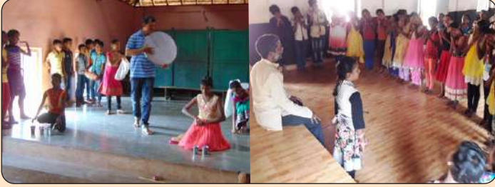
ಮಕ್ಕಳ ಹಕ್ಕುಗಳ ರಂಗ ತಂಡಕ್ಕೆ ತರಬೇತಿ