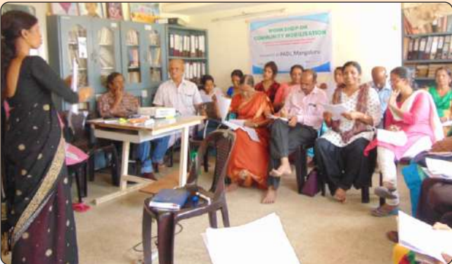
ಎಸ್.ಡಿ.ಎಮ್.ಸಿ ತರಬೇತುದಾರರಿಗೆ ತರಬೇತಿ

ಎಸ್.ಡಿ.ಎಮ್.ಸಿ ತರಬೇತುದಾರರಿಗೆ ತರಬೇತಿ ಕೈಪಿಡಿಯಲ್ಲಿನ ಅಂಶಗಳ ಕುರಿತು ತರಬೇತಿ ಹಾಗೂ ತರಬೇತುದಾರರು