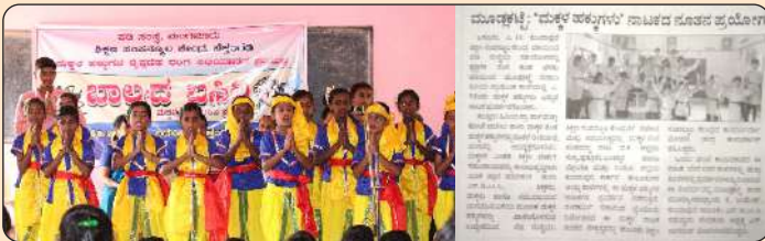
ರಂಗ ತಂಡಗಳ ಪ್ರದರ್ಶನ

ತರಬೇತಿ ಪಡೆದ ಮಕ್ಕಳ ರಂಗ ತಂಡಗಳು ಸಮುದಾಯದತ್ತ ಶಾಲೆ, ಶಾಲಾ ವಾರ್ಷಿಕೋತ್ಸವ ಮತ್ತು ಇತರ ಜಾಗೃತಿ ಕಾರ್ಯಕ್ರಮಗಳಲ್ಲಿ ತಮ್ಮ ಪ್ರದರ್ಶನವನ್ನು ನೀಡಿ ಸಮುದಾಯದಲ್ಲಿ ಮಕ್ಕಳ ಹಕ್ಕುಗಳ ಬಗ್ಗೆ ಜಾಗೃತಿ ಕಾರ್ಯಕ್ರಮವನ್ನು ನೀಡುತ್ತಾ ಬರುತ್ತಿದೆ. ಶಿಕ್ಷಣ ಸಂಪನ್ಮೂಲ ಕೇಂದ್ರಗಳು ತಮ್ಮ ಮಕ್ಕಳ ಹಕ್ಕುಗಳ ಶೈಕ್ಷಣಿಕ ರಂಗ ತಂಡಗಳ ಜವಾಬ್ದಾರಿಯನ್ನು ವಹಿಸಿಕೊಂಡು ತಾಲೂಕಿನಾದ್ಯಂತ ಅರಿವು ಕಾರ್ಯಕ್ರಮಗಳನ್ನು ಹಮ್ಮಿಕೊಳ್ಳುತ್ತಾ ಬರುತ್ತಿದೆ.