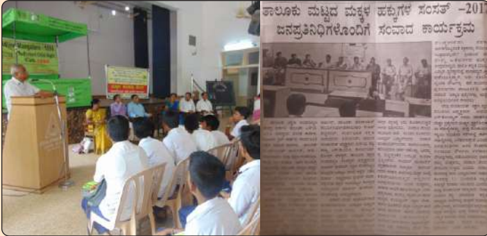
ಮಕ್ಕಳ ಸಂಸತ್ತು ಕಾರ್ಯಕ್ರಮ