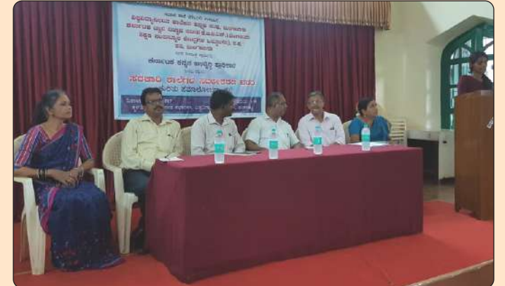
ಸರಕಾರಿ ಶಾಲೆಗಳ ಸಬಲೀಕರಣ ವರದಿಯ ಸಮಾಲೋಚನಾ ಸಭೆ

2. ಮಕ್ಕಳ ಮಾಸೋತ್ಸವ: ಮಕ್ಕಳ ದಿನಾಚರಣೆಯ ಅಂಗವಾಗಿ ಮಕ್ಕಳ ಮಾಸೋತ್ಸವ ಕಾರ್ಯಕ್ರಮವನ್ನು ನವೆಂಬರ್ ತಿಂಗಳಲ್ಲಿ ದ.ಕ. ಮತ್ತು ಉಡುಪಿ ಜಿಲ್ಲೆಯಾದ್ಯಂತ ಕಾರ್ಯಕ್ರಮ ನಡೆಯಿತು. ಪ್ರಮುಖವಾಗಿ ಮಕ್ಕಳ ಚಾರ್ಟರ್ ರಚನೆ ಮತ್ತು ನಾಗರಿಕ ಸನ್ನದಿನಂತೆ ಮಕ್ಕಳ ಸನ್ನದನ್ನು ಕೂಡಾ ರಚನೆ ಮಾಡಿ ವೆಬ್‌ಸೈಟ್‌ನಲ್ಲಿ ಅಳವಡಿಸುವಂತೆ ಜಿಲ್ಲಾಧಿಕಾರಿಗೆ ಮನವಿ, ಮಕ್ಕಳ ಸುರಕ್ಷಾ ನೀತಿಯನ್ನು ಎಲ್ಲಾ ಶೈಕ್ಷಣಿಕ ಸಂಸ್ಥೆ ಮತ್ತು ಪಂಚಾಯತುಗಳಲ್ಲಿ ಅನುಷ್ಠಾನಗೊಳಿಸುವಂತೆ ಮನವಿಯನ್ನು ಮಾನ್ಯ ಮುಖ್ಯ ಕಾರ್ಯನಿರ್ವಾಹಣಾಧಿಕಾರಿಗಳಿಗೆ ದ.ಕ ಜಿಲ್ಲೆಯಲ್ಲಿ ಮನವಿಯನ್ನು ನೀಡಲಾಗಿದ್ದು ಬಾಲ್ಯ ವಿವಾಹ ಮತ್ತು ಬಾಲ ಕಾರ್ಮಿಕತೆ, ಶಿಕ್ಷಾ ರಹಿತ ಶಿಕ್ಷಣ, ಪೊಲೀಸರೊಂದಿಗೆ ಸಂವಾದ, ಪೋಕ್ಸೋ, ಪೋಷಕತ್ವ, ಸುಸ್ಥಿರ ಅಭಿವೃದ್ಧಿ ಗುರಿ ವಿಷಯಗಳಿಗೆ ಸಂಬಂಧಿಸಿದಂತೆ ಮಾಹಿತಿ ಅರಿವು, ಮಕ್ಕಳ ಹಕ್ಕುಗಳ ರಕ್ಷಣಾ ವ್ಯವಸ್ಥೆಗಳ ಬಗ್ಗೆ ತಳಮಟ್ಟದಲ್ಲಿ ಮಾಹಿತಿ