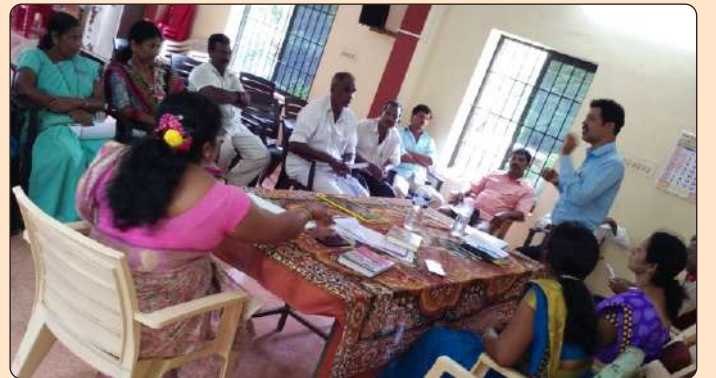
ಸಂಪನ್ಮೂಲ ವ್ಯಕ್ತಿಗಳಿಂದ ಮೌಲ್ಯಮಾಪನ

ಮಗುಸ್ನೇಹಿ ವಾತಾವರಣ ನಿರ್ಮಾಣ ಯೋಜನೆಗೆ ಆಯ್ಕೆಯಾದ ಉಡುಪಿ ಮತ್ತು ದ.ಕ ಜಿಲ್ಲೆಯ 6 ಕ್ಲಸ್ಟರ್‌ನ 52 ಶಾಲೆ, 15 ಪಂಚಾಯತು ಮತ್ತು ಅದರಲ್ಲಿ ಅಸ್ತಿತ್ವದಲ್ಲಿರಬೇಕಾದ 15 ಮಕ್ಕಳ ರಕ್ಷಣಾ ಸಮಿತಿಯ ವಸ್ತು ಸ್ಥಿತಿ ಅಧ್ಯಯನವನ್ನು ನಿಯೋಜಿಸಲ್ಪಟ್ಟ ಸಂಪನ್ಮೂಲ ವ್ಯಕ್ತಿಗಳು ಕ್ಷೇತ್ರ ಭೇಟಿ ಮಾಡಿ ಉದ್ದೇಶಿತ ಗುಂಪುಗಳೊಂದಿಗೆ ಚರ್ಚಿಸಿ ದಾಖಲೆಗಳನ್ನು ಪರಿಶೀಲಿಸಿ ಅಭಿವೃದ್ಧಿ ಪಡಿಸಿದ ಪ್ರಶ್ನಾವಳಿಯ ಮೂಲಕ ಮೌಲ್ಯಮಾಪನ ಮಾಡಿ ಪಡಿ ಸಂಸ್ಥೆಗೆ ವರದಿಯನ್ನು ಸಲ್ಲಿಸಿದ್ದು ಅದನ್ನು ಕ್ರೋಢೀಕರಿಸಿ, ವಿಶ್ಲೇಷಿಸಿ ತರಬೇತಿ ಅವಶ್ಯಕತೆ ಇರುವ ಕ್ಷೇತ್ರಗಳಲ್ಲಿ ಗುರುತಿಸಿ ತರಬೇತಿ ಕೈಪಿಡಿ ರಚಿಸಲು ಈ ಮೌಲ್ಯಮಾಪನ ಅನುಕೂಲವಾಯಿತು.