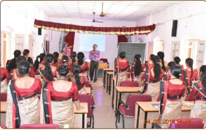
ಡಿ.ಇಎಲ್.ಇಡಿ. ಪ್ರಶಿಕ್ಷಣಾರ್ಥಿಗಳಿಗೆ ತರಬೇತಿ

ಹೊಂದಿಕೊಳ್ಳುವ ವಾತಾವರಣವನ್ನು ನಿರ್ಮಾಣ ಮಾಡುವಲ್ಲಿ ಮತ್ತು ವಿದ್ಯಾರ್ಥಿಗಳಲ್ಲಿ ತರಬೇತಿಯ ಕುರಿತಂತೆ ಆಶಾಭಾವನೆಯನ್ನು ಮೂಡಿಸುವಲ್ಲಿ ಈ ಪ್ರವೇಶಿಕೆ ತರಬೇತಿಯು ಸಹಕಾರಿಯಾಯಿತು. ದ.ಕ ಜಿಲ್ಲೆಯ ಡಿ.ಇಎಲ್.ಇಡಿ ಸಂಸ್ಥೆಯ ಉಪನ್ಯಾಸಕರು ಸಂಪನ್ಮೂಲ ವ್ಯಕ್ತಿಗಳಾಗಿದ್ದರು. ಮಕ್ಕಳು ಮುಖ್ಯವಾಗಿ ಸಂವಹನ, ನಾಯಕತ್ವ, ಆದರ್ಶಶಿಕ್ಷಕರು, ಶಿಕ್ಷಕರ ಕರ್ತವ್ಯ ಮತ್ತು ಜವಾಬ್ದಾರಿಗಳು, ನೈತಿಕ ಮೌಲ್ಯಗಳು, ಶಿಕ್ಷಕ ಶಿಕ್ಷಣ ತರಬೇತಿಯ ಅವಕಾಶಗಳು ಮೊದಲಾದ ವಿಷಯಗಳ ಕುರಿತು ಮೂರು ದಿನಗಳಲ್ಲಿ ಚಟುವಟಿಕೆಯಾಧಾರಿತವಾಗಿ ಅಧಿವೇಶನ ನಡೆಯಿತು. ವಿದ್ಯಾರ್ಥಿಗಳು ಪ್ರವೇಶಿಕೆ ತರಬೇತಿಯ ಪ್ರಾಯೋಗಿಕ ಅನುಷ್ಠಾನದ ಬಗ್ಗೆ ತಮ್ಮ ಅಭಿಪ್ರಾಯಗಳನ್ನು ಹಂಚಿಕೊಂಡರು.