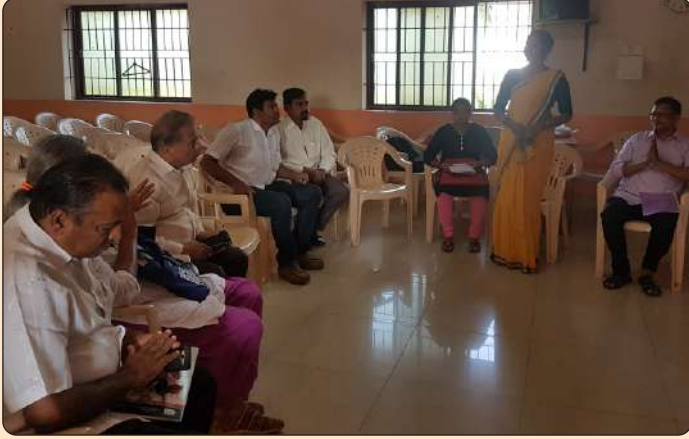
ಹಾಸ್ಟೆಲ್ ನೀತಿ ಕುರಿತಂತೆ ಸಮಾಲೋಚನಾ ಸಭೆ

ಶಿಕ್ಷಣಾಸಕ್ತರು, ವಿವಿಧ ಸಂಘ ಸಂಸ್ಥೆಗಳ ಪ್ರತಿನಿಧಿಗಳು ಭಾಗವಹಿಸಿ ನೀತಿಯ ಬಗ್ಗೆ ಚರ್ಚಿಸಲಾಯಿತು. ಎಲ್ಲಾ ಶಾಲಾ ಕಾಲೇಜುಗಳ ವಸತಿನಿಲಯಗಳಲ್ಲಿ ಯಥಾವತ್ತು ಅನುಷ್ಠಾನ ಮಾಡುವಲ್ಲಿ ಸುತ್ತೋಲೆಯನ್ನು ಹೊರಡಿಸುವಂತೆ ಮನವಿ ಸಲ್ಲಿಸಲು ತೀರ್ಮಾನಿಸಲಾಯಿತು.