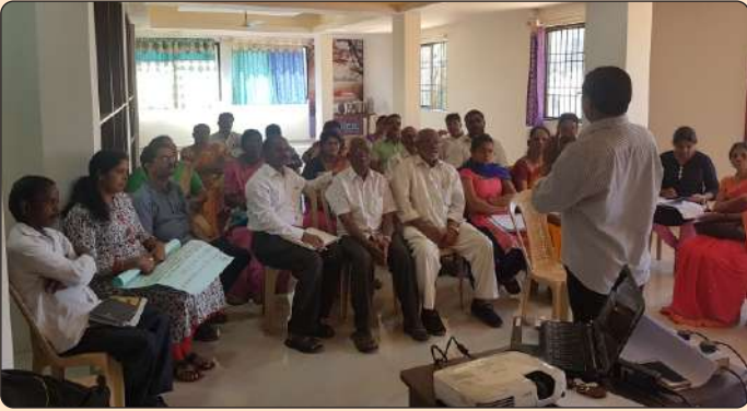
ಶಿಕ್ಷಣ ಸಂಪನ್ಮೂಲ ಕೇಂದ್ರಗಳ ಒಕ್ಕೂಟದೊಂದಿಗೆ ಸಮಾಲೋಚನೆ

1. ಎಮ್.ಒ.ಯು. ಪಡಿ ಮತ್ತು ಶಿಕ್ಷಣ ಸಂಪನ್ಮೂಲ ಕೇಂದ್ರಗಳ ಒಕ್ಕೂಟ ಮತ್ತು ಅದರ ಘಟಕಗಳೊಂದಿಗೆ ಯೋಜನಾ ಚಟುವಟಿಕೆಗಳ ಕುರಿತಂತೆ ಮತ್ತು ಆಡಳಿತಾತ್ಮಕ ವ್ಯವಹಾರಗಳ ನಡುವಿನ ಪಾತ್ರಗಳ ಬಗೆಗಿನ ಸ್ಪಷ್ಟತೆಗಾಗಿ ಒಪ್ಪಂದವನ್ನು ನಡೆಸಲು ಸಮಾಲೋಚನಾ ಸಭೆಯನ್ನು ನಡೆಸಿ ಚರ್ಚಿಸಿ ಅಂತಿಮಗೊಳಿಸಲಾಯಿತು. ಅಲ್ಲದೆ ಒಪ್ಪಂದದ ಕರಾರಿಗೆ ಬದ್ಧರಾಗಿ ಕಾರ್ಯನಿರ್ವಹಿಸುವುದರ ಬಗ್ಗೆ ಸಹಿಯನ್ನು ಹಾಕಲಾಯಿತು.