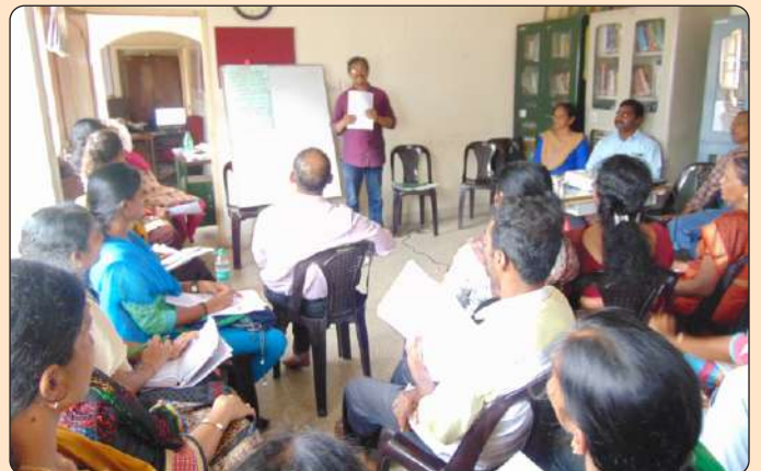
ಪಂಚಾಯತ್ ತರಬೇತುದಾರರಿಗೆ ತರಬೇತಿ

ಮಗುಸ್ನೇಹಿ ಗ್ರಾಮ ಪಂಚಾಯತು ಪರಿಕಲ್ಪನೆಯನ್ನು ಪಂಚಾಯತುಗಳಲ್ಲಿ ಅನುಷ್ಠಾನ ಮಾಡುವಲ್ಲಿ ಮತ್ತು ಮಕ್ಕಳ ರಕ್ಷಣಾ ನೀತಿಯ ಕುರಿತು ಪಂಚಾಯತು ಸದಸ್ಯರಿಗೆ ಹಾಗೂ ಸಿಬ್ಬಂದಿಗಳಿಗೆ ತರಬೇತಿಯನ್ನು ನೀಡುವ ಕುರಿತಂತೆ ಸಂಪನ್ಮೂಲ ವ್ಯಕ್ತಿಗಳಾಗಿ ಮಾಹಿತಿ ನೀಡುವವರಿಗೆ ಪಡಿ ಕಛೇರಿಯಲ್ಲಿ ದಿನಾಂಕ 23.02.2018 ರಂದು ನಡೆಯಿತು.