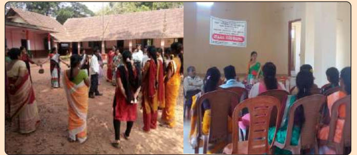
ಶಾಲಾಮಟ್ಟದಲ್ಲಿ ಎಸ್.ಡಿ.ಎಮ್.ಸಿ ತರಬೇತಿ-ಮೊದಲ ಹಂತ

ಉಡುಪಿ ಜಿಲ್ಲೆಯ ಬೈಲೂರು ಮತ್ತು ತಲ್ಲೂರು ಹಾಗೂ ದ.ಕ ಜಿಲ್ಲೆಯ ಮಧ್ವ, ಉಜಿರೆ, ಹಾರಾಡಿ, ಆಲೆಟ್ಟಿ ಕ್ಲಸ್ಟರ್‌ನ 52 ಶಾಲೆಗಳಿಗೆ ಮೊದಲ ಹಂತದಲ್ಲಿ ಎಸ್.ಡಿ.ಎಮ್.ಸಿಯ ಪಾತ್ರ ಮತ್ತು ಜವಾಬ್ದಾರಿಗಳ ಬಗ್ಗೆ ತರಬೇತಿಯನ್ನು ಆಯಾಯ ಶಾಲೆಗಳಲ್ಲಿ ನಿಯೋಜಿಸಲ್ಪಟ್ಟ ಸಂಪನ್ಮೂಲ ವ್ಯಕ್ತಿಗಳು ಡಿಸೆಂಬರ್ ತಿಂಗಳಲ್ಲಿ ನೀಡಿದರು. ಎಸ್.ಡಿ.ಎಮ್.ಸಿ ಸಮಿತಿಯು ಶಾಲೆಗಳಲ್ಲಿ ಅಸ್ತಿತ್ವಕ್ಕೆ ಬಂದ ನಂತರ ಸರಿಯಾದ ಮಾರ್ಗದರ್ಶನ ಮತ್ತು ತರಬೇತಿಯ ಅವಶ್ಯಕತೆಯನ್ನು ಎಲ್ಲಾ ಎಸ್.ಡಿ.ಎಮ್.ಸಿ ಸದಸ್ಯರು ಈ ತರಬೇತಿಯಲ್ಲಿ ಕಂಡುಕೊಂಡರು. ಅಲ್ಲದೇ ತರಬೇತಿಯು ಚಟುವಟಿಕೆಯಾಧಾರಿತವಾಗಿ ಮತ್ತು ಚಿತ್ರಾತ್ಮಕ ತರಬೇತಿ ಪರಿಕರಗಳ ಮೂಲಕ ಅರ್ಥೈಸಲಾಯಿತು.