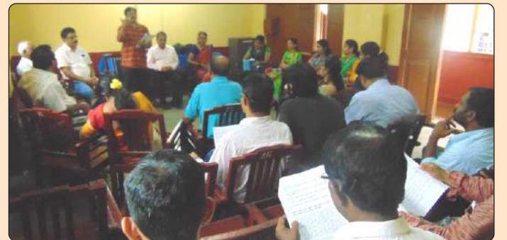
ಮಕ್ಕಳ ರಕ್ಷಣಾ ವ್ಯವಸ್ಥೆಯನ್ನು ಬಲಪಡಿಸುವ ಕುರಿತು ಸಮಾಲೋಚನಾ ಸಭೆ

8. ಮಕ್ಕಳ ರಕ್ಷಣಾ ವ್ಯವಸ್ಥೆ ಬಲಪಡಿಸಲು ಸಮಾಲೋಚನಾ ಸಭೆ: ದ.ಕ ಜಿಲ್ಲೆಯಲ್ಲಿ ಮಕ್ಕಳ ಮೇಲೆ ನಡೆಯುವ ದೌರ್ಜನ್ಯ ಪ್ರಕರಣಗಳ ಸಂಖ್ಯೆಗಳು ಹೆಚ್ಚಾಗುತ್ತಿದ್ದು ಅದರ ಕುರಿತಂತೆ ಮಕ್ಕಳ ರಕ್ಷಣಾ ವ್ಯವಸ್ಥೆಗಳನ್ನು ಬಲಪಡಿಸುವ ನಿಟ್ಟಿನಲ್ಲಿ ಮತ್ತು ಕಾವ್ಯಳ ಸಾವಿನ ಪ್ರಕರಣಕ್ಕೆ ಸಂಬಂಧಿಸಿದಂತೆ ಕರ್ನಾಟಕ ರಾಜ್ಯ ಮಕ್ಕಳ ಹಕ್ಕುಗಳ ರಕ್ಷಣಾ ಆಯೋಗವು ಹೊರ ತಂದಿರುವ ವರದಿಯ ಅನುಷ್ಠಾನದ ಕುರಿತಂತೆ ಚರ್ಚೆ ನಡೆಸಲಾಯಿತು. 40 ಅಂಶಗಳ ಬೇಡಿಕೆಗಳ ಈಡೇರಿಕೆಗಾಗಿ ಜಿಲ್ಲಾಧಿಕಾರಿಗಳಿಗೆ ವಕಾಲತ್ತು ಮಾಡಲಾಯಿತು.