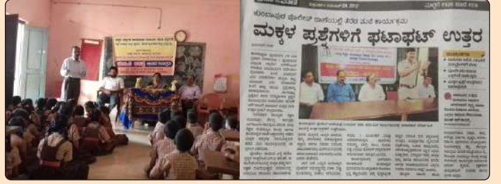
ಮಕ್ಕಳ ಮಾಸೋತ್ಸವ ಕಾರ್ಯಕ್ರಮ

ದ.ಕ ಮತ್ತು ಉಡುಪಿ ಜಿಲ್ಲೆಯ ಮಂಗಳೂರು, ಪುತ್ತೂರು, ಬೆಳ್ತಂಗಡಿ, ಸುಳ್ಯ, ಉಡುಪಿ, ಕಾರ್ಕಳ ಮತ್ತು ಕುಂದಾಪುರ ತಾಲೂಕಿನಲ್ಲಿ ಹಾಗೂ ಜಿಲ್ಲಾ ಮಟ್ಟದಲ್ಲಿ ಒಂದೊಂದು ಕಾರ್ಯಕ್ರಮಗಳು ನಡೆದು ಸುಮಾರು 800 ಮಕ್ಕಳು ಮಕ್ಕಳ ಸಂಸತ್ತು ಕಾರ್ಯಕ್ರಮದಲ್ಲಿ ಭಾಗವಹಿಸಿರುತ್ತಾರೆ. ಆಯಾಯ ತಾಲೂಕಿನ ಶಾಸಕರ ಜೊತೆ ಮಕ್ಕಳು ನೇರವಾಗಿ ಸಂವಾದ ನಡೆಸಿ ತಮ್ಮ ಬೇಡಿಕೆಗಳನ್ನು ಶಾಸಕರ ಮುಂದೆ ಇಟ್ಟು ಬಗೆಹರಿಸುವಂತೆ ವಿನಂತಿಸಿಕೊಂಡರು. ಮಕ್ಕಳ ಬೇಡಿಕೆಗಳಲ್ಲಿ ಶಾಲಾ ಮೂಲಭೂತ ಸೌಕರ್ಯ, ಮಕ್ಕಳ ರಕ್ಷಣೆಗೆ ಪೂರಕವಾದ ವ್ಯವಸ್ಥೆಗಳ ಅನುಷ್ಠಾನ, ಶಿಕ್ಷಕರ ಕೊರತೆ, ಗುಣಾತ್ಮಕ ಶಿಕ್ಷಣದಲ್ಲಿನ ಕೊರತೆ ಇತ್ಯಾದಿ ಪ್ರಮುಖ ವಿಚಾರಗಳ ಕುರಿತಂತೆ ಚರ್ಚೆ ನಡೆದು ಕೆಲವೊಂದು ಅಂಶಗಳನ್ನು ತಕ್ಷಣದಲ್ಲಿ ಪರಿಹಾರ ಕಂಡುಕೊಳ್ಳುವಲ್ಲಿ ಶಾಸಕರು ಅಧಿಕಾರಿಗಳಿಗೆ ನಿರ್ದೇಶನ ನೀಡಿದರು. ಮಕ್ಕಳ ಈ ಬೇಡಿಕೆಯನ್ನು ಕ್ರೋಢೀಕರಿಸಿ ಅನುಷ್ಠಾನ ಮಾಡುವಲ್ಲಿ ಮುಂದಿನ ದಿನಗಳಲ್ಲಿ ಪ್ರಯತ್ನಿಸುವುದಾಗಿ ಭರವಸೆಯನ್ನು ನೀಡಿದರು.