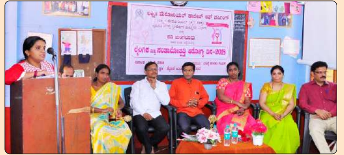
ಸ.ಹಿ.ಪ್ರಾ.ಶಾಲೆ ಕೆದ್ದಳಿಕೆಯಲ್ಲಿ ಅರಿವು ಕಾರ್ಯಕ್ರಮ

ದಿನಾಂಕ 12.2.2018ರಂದು ಸ.ಹಿ.ಪ್ರಾ. ಶಾಲೆ ಕೆದ್ದಳಿಕೆಯಲ್ಲಿ ಪಡಿ ಮತ್ತು ಲಕ್ಷ್ಮೀ ಮೆಮೋರಿಯಲ್ ಕಾಲೇಜ್ ಆಫ್ ನರ್ಸಿಂಗ್ ಇವರ ಜಂಟಿ ಆಶ್ರಯದಲ್ಲಿ ಲೈಂಗಿಕ ಮತ್ತು ಸಂತಾನೋತ್ಪತ್ತಿ ಆರೋಗ್ಯದ ಕುರಿತು ಅರಿವು ಕಾರ್ಯಕ್ರಮವನ್ನು ಶಾಲೆಯ ಮಕ್ಕಳಿಗೆ ಹಮ್ಮಿಕೊಳ್ಳಲಾಯಿತು. ಹದಿಹರೆಯ ಸಂದರ್ಭಗಳಲ್ಲಿ ಮಕ್ಕಳಲ್ಲಿ ಉಂಟಾಗುವ ಬದಲಾವಣೆಗಳ ಕುರಿತಂತೆ ಮತ್ತು ಮಕ್ಕಳ ಹಕ್ಕುಗಳ ಬಗ್ಗೆ ಸಂಪನ್ಮೂಲ ವ್ಯಕ್ತಿಗಳು ಮಾಹಿತಿ ನೀಡಿದರು.