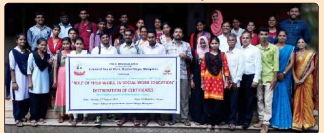
ಸಮಾಜ ಕಾರ್ಯ ವಿದ್ಯಾರ್ಥಿಗಳಿಗೆ ಓರಿಯಂಟೇಶನ್ ತರಬೇತಿ