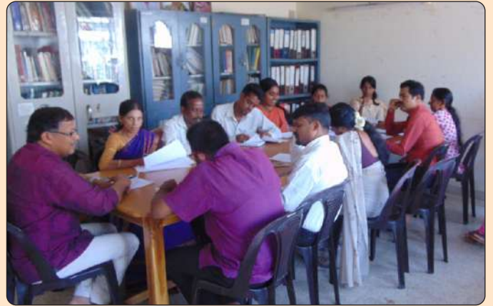
ಪಂಚಾಯತ್ ತರಬೇತಿ ಕೈಪಿಡಿ ರಚನಾ ಸಭೆ

ಸಮಾಲೋಚನಾ ಸಭೆಯನ್ನು ದಿನಾಂಕ 06.02.2018ರಂದು ಪಡಿ ಕಛೇರಿಯಲ್ಲಿ ನಡೆಸಲಾಯಿತು. ಈ ತರಬೇತಿ ಕೈಪಿಡಿ ರಚನಾ ಸಭೆಯಲ್ಲಿ ಪಂಚಾಯತು ಅಭಿವೃದ್ಧಿ ಅಧಿಕಾರಿಗಳು, ಮತ್ತು ಪಂಚಾಯತ್‌ರಾಜ್ ಸಂಸ್ಥೆಗಳಿಗೆ ತರಬೇತಿ ನೀಡಿದಂತಹ ಸಂಪನ್ಮೂಲ ವ್ಯಕ್ತಿಗಳು, ಸಾಮಾಜಿಕ ಆಡಿಟಿಂಗ್‌ನಲ್ಲಿ ಅನುಭವವಿರುವ ಮತ್ತು ಪಂಚಾಯತ್ ರಾಜ್ ವ್ಯವಸ್ಥೆಯಲ್ಲಿ ಅನುಭವವಿರುವ ತಜ್ಞರು ಭಾಗವಹಿಸಿದ್ದು ತರಬೇತಿ ಕೈಪಿಡಿಯ ರೂಪರೇಷೆಗಳನ್ನು ತಯಾರಿಸಲಾಯಿತು.