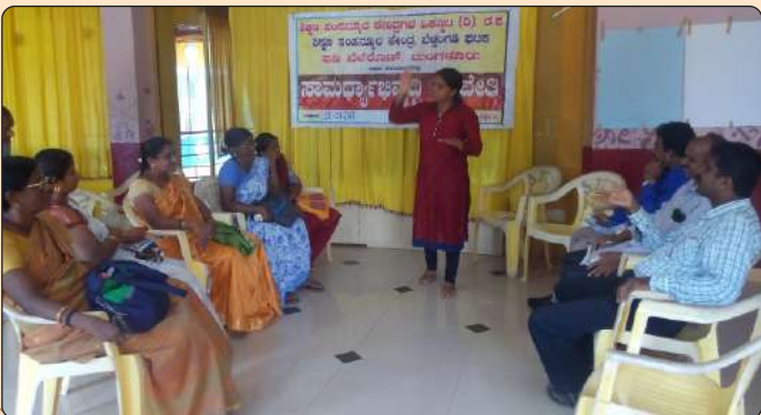
ಶಿಕ್ಷಣ ಸಂಪನ್ಮೂಲ ಕೇಂದ್ರಗಳಿಗೆ ಸಾಮರ್ಥ್ಯ ವರ್ಧನ ತರಬೇತಿ

ಶಿಕ್ಷಣ ಸಂಪನ್ಮೂಲ ಕೇಂದ್ರಗಳ ಒಕ್ಕೂಟ ಮತ್ತು ಅದರ 8 ಘಟಕಗಳಿಗೆ ವಿವಿಧ ವಿಷಯಗಳ ಮೇಲೆ ತರಬೇತಿಯನ್ನು