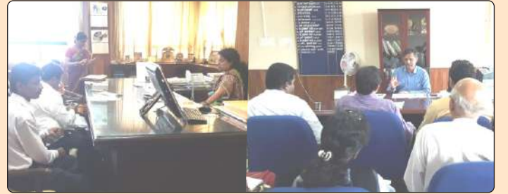
ಜಿಲ್ಲಾಧಿಕಾರಿ ಮತ್ತು ಮುಖ್ಯ ಕಾರ್ಯನಿರ್ವಹಣಾಧಿಕಾರಿಯೊಂದಿಗೆ ವಕಾಲತ್ತು

ಉಡುಪಿ ಮತ್ತು ದ.ಕ ಜಿಲ್ಲೆಯಲ್ಲಿ ಶಿಕ್ಷಣ ಇಲಾಖೆ, ಪಂಚಾಯತ್ ರಾಜ್ ಇಲಾಖೆ ಮತ್ತು ಆರೋಗ್ಯ ಇಲಾಖೆಗಳೊಂದಿಗೆ ಮಗುಸ್ನೇಹಿ ಪರಿಕಲ್ಪನೆಯ ಅನುಷ್ಠಾನಕ್ಕಾಗಿ ಇಲಾಖಾ ಸಹಕಾರ ಕೋರುವ ಕುರಿತು ಜಿಲ್ಲಾ ಪಂಚಾಯತು ಮುಖ್ಯ ಕಾರ್ಯನಿರ್ವಹಣಾಧಿಕಾರಿಯವರಿಗೆ, ಶಿಕ್ಷಣ ಇಲಾಖೆಯ ಉಪನಿರ್ದೇಶಕರೊಂದಿಗೆ, ಆರೋಗ್ಯ ಇಲಾಖೆಯ ಅಧಿಕಾರಿಗಳೊಂದಿಗೆ, ಜಿಲ್ಲಾ ಮಕ್ಕಳ ರಕ್ಷಣಾ ಘಟಕದೊಂದಿಗೆ ಮತ್ತು ಪಂಚಾಯತ್ ಅಭಿವೃದ್ಧಿ ಅಧಿಕಾರಿಗಳೊಂದಿಗೆ ಮಗುಸ್ನೇಹಿ ಶಾಲೆ, ಮಗುಸ್ನೇಹಿ ಪಂಚಾಯತು ಮತ್ತು ಮಕ್ಕಳ ರಕ್ಷಣಾ ಸಮಿತಿಯ ಪರಿಕಲ್ಪನೆಯ ಅನುಷ್ಠಾನಕ್ಕಾಗಿ ಇಲಾಖಾ ಸಹಕಾರ ಮತ್ತು ಅನುಮತಿ ಬಯಸುವ ನಿಟ್ಟಿನಲ್ಲಿ ವಕಾಲತ್ತು ಪ್ರಕ್ರಿಯೆಯನ್ನು ನಡೆಸಲಾಯಿತು.