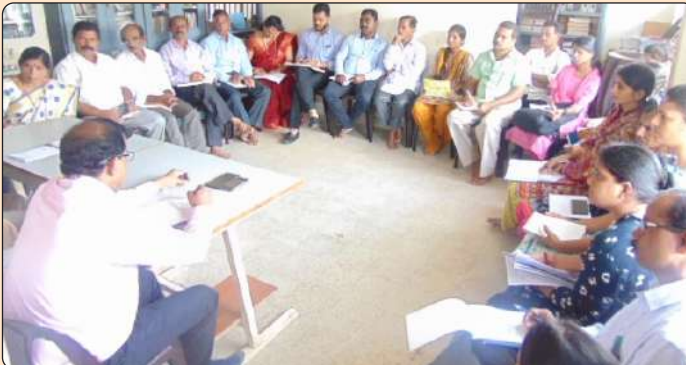
ರಂಗ ತರಬೇತುದಾರರೊಂದಿಗೆ ಸಮಾಲೋಚನೆ

ದಿನಾಂಕ 3.10.2017ರಂದು ಪಡಿ ಸಭಾಂಗಣದಲ್ಲಿ ಮಕ್ಕಳ ಹಕ್ಕುಗಳ ಶೈಕ್ಷಣಿಕ ರಂಗ ಅಭಿಯಾನ ಪರಿಕಲ್ಪನೆಯ ಸಾಕಾರಕ್ಕಾಗಿ ಮತ್ತು ರಂಗ ತಂಡದ ರೂಪುರೇಷೆಗಳು ಮತ್ತು ಸ್ವರೂಪದ ಬಗ್ಗೆ ಚರ್ಚಿಸಲು ರಂಗ ಅಭಿಯಾನ, ನಾಟಕ ಕಲೆಗಳಲ್ಲಿ ಅನುಭವವಿರುವ ಸಂಪನ್ಮೂಲ ವ್ಯಕ್ತಿಗಳೊಂದಿಗೆ ಸಮಾಲೋಚನಾ ಸಭೆಯನ್ನು ನಡೆಸಲಾಯಿತು. ಈ