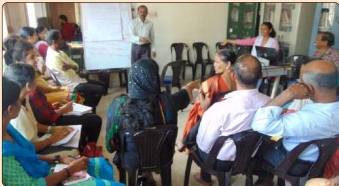
ಸಂಪನ್ಮೂಲ ವ್ಯಕ್ತಿಗಳಿಗೆ ಮೌಲ್ಯಮಾಪನ ಮಾಡುವ ಕುರಿತಂತೆ ತರಬೇತಿ

ಮಗುಸ್ನೇಹಿ ಶಾಲಾ ವಾತಾವರಣ ನಿರ್ಮಾಣಕ್ಕಾಗಿ ಶಾಲೆಯ ಅಭಿವೃದ್ಧಿಯಲ್ಲಿ ಪ್ರಮುಖ ಪಾಲುದಾರ ಸಮಿತಿಯಾದ ಶಾಲಾಭಿವೃದ್ಧಿ ಮತ್ತು ಮೇಲುಸ್ತುವಾರಿ ಸಮಿತಿ ಯಾವ ರೀತಿ ಶಾಲಾಭಿವೃದ್ಧಿಯಲ್ಲಿ ತನ್ನ ಕೊಡುಗೆಯನ್ನು ನೀಡುತ್ತಿದೆ ಮತ್ತು ಅದರ ಕಾರ್ಯವೈಖರಿಯ ಕುರಿತಂತೆ ಮೌಲ್ಯಮಾಪನವನ್ನು ಅಭಿವೃದ್ಧಿ ಪಡಿಸಿದ ಪ್ರಶ್ನಾವಳಿಯ ಮೂಲಕ ಆಯಾಯ ಶಿಕ್ಷಣ ಸಂಪನ್ಮೂಲ ಕೇಂದ್ರದಿಂದ ನಿಯೋಜಿಸಲ್ಪಟ್ಟ ಸಂಪನ್ಮೂಲ ವ್ಯಕ್ತಿಗಳಿಗೆ ಹೇಗೆ ಮೌಲ್ಯಮಾಪನ ಮಾಡಬೇಕು ಮತ್ತು ಮೌಲ್ಯಮಾಪನ ಮಾಡುವಾಗ ಯಾವೆಲ್ಲಾ ಅಂಶಗಳನ್ನು ಗಮನಿಸಬೇಕು ಮತ್ತು ಯಾವೆಲ್ಲಾ ದಾಖಲೆಗಳ ಪರಿಶೀಲನೆ ಮಾಡಬೇಕು ಎಂಬುದರ ಕುರಿತಂತೆ ಮತ್ತು