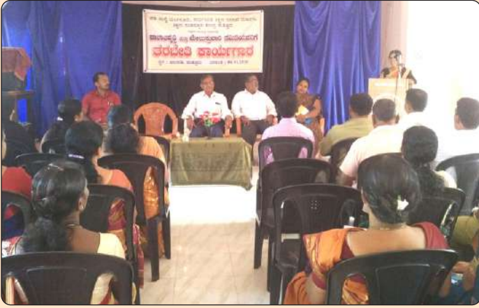
ಶಾಲಾಮಟ್ಟದಲ್ಲಿ ಎಸ್.ಡಿ.ಎಂ.ಸಿ ತರಬೇತಿ-ಎರಡನೇ ಹಂತ

ಯೋಜನೆಯ ಪರಿಕಲ್ಪನೆ ಮತ್ತು ಅವಶ್ಯಕತೆ, ಅದರ ಪ್ರಕ್ರಿಯೆ ಮತ್ತು ಅನುಷ್ಠಾನದ ಅಂಶಗಳ ಕುರಿತಂತೆ ತರಬೇತಿಯ ಜೊತೆಗೆ ಮುಖ್ಯವಾಗಿ ಶಾಲಾ ಮೂಲಭೂತ ಸೌಕರ್ಯ, ಮಕ್ಕಳ ಕಲಿಕಾ ಗುಣಮಟ್ಟ, ಸಮುದಾಯದ ಭಾಗವಹಿಸುವಿಕೆ ಮತ್ತು ಮಕ್ಕಳ ರಕ್ಷಣೆ ಮುಂತಾದ ಪ್ರಮುಖ ಕ್ಷೇತ್ರಗಳನ್ನು ಗಮನದಲ್ಲಿಟ್ಟುಕೊಂಡು ಯೋಜನೆಯನ್ನು ರೂಪಿಸುವುದರ ಜತೆಗೆ ಸಂಪನ್ಮೂಲಗಳ ಕ್ರೋಢೀಕರಣದ ಬಗ್ಗೆಯೂ ತರಬೇತಿಯನ್ನು ಉಡುಪಿ ಮತ್ತು ದ.ಕ ಜಿಲ್ಲೆಯ 6 ಕ್ಲಸ್ಟರ್‌ನ 52 ಶಾಲೆಗಳ ಎಸ್.ಡಿ.ಎಂ.ಸಿ ಸದಸ್ಯರಿಗೆ 2018 ರ ಮಾರ್ಚ್ ತಿಂಗಳಲ್ಲಿ ತರಬೇತಿಯನ್ನು ನೀಡಲಾಯಿತು.