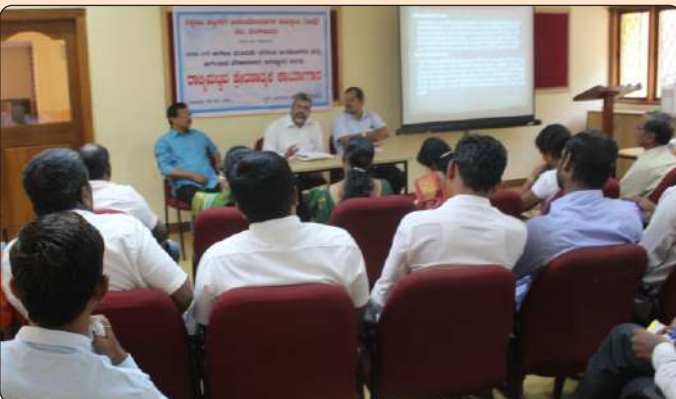
ಶಿಕ್ಷಣ ಹಕ್ಕು ಕಾಯಿದೆ ಜಾರಿ ಸ್ಥಿತಿಗತಿ ವರದಿ ಮಂಡನೆ

ಪಾಘೈಯ ಜೊತೆ ಕೈಜೋಡಿಸಿರುವ ಸಂಸ್ಥೆಗಳು ಮತ್ತು ಸಂಘಟನೆಗಳ ಜೊತೆಗೆ ಶಿಕ್ಷಣ ಹಕ್ಕು ಕಾಯಿದೆಯ ಪರಿಣಾಮಕಾರಿ ಅನುಷ್ಠಾನಕ್ಕಾಗಿ ಮುಂದಿನ ಯೋಜನೆಗಳ ಕುರಿತು ಚರ್ಚಿಸುವ ಸಲುವಾಗಿ ಮತ್ತು ಕಳೆದ ಭಾರಿ ಪಾಘೈಯ