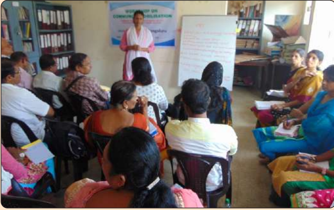
ಎಸ್.ಡಿ.ಎಮ್.ಸಿ. ತರಬೇತಿ ಕೈಪಿಡಿ ರಚನಾ ಕಾರ್ಯಾಗಾರ

ಆಧಾರದಲ್ಲಿ ಮತ್ತು ಶಾಲೆ ಮತ್ತು ಎಸ್.ಡಿ.ಎಮ್.ಸಿ ಕ್ಷೇತ್ರದಲ್ಲಿ ಅನುಭವವಿರುವ ತಜ್ಞರನ್ನು ಒಳಗೊಂಡಂತೆ ತರಬೇತಿ ಕೈಪಿಡಿಯನ್ನು ರಚಿಸಲು ದಿನಾಂಕ 27.11.2017 ರಂದು ಪಡಿ ಸಂಸ್ಥೆಯಲ್ಲಿ ಸವಾಲೋಚನಾ ಸಭೆಯನ್ನು ಆಯೋಜಿಸಲಾಯಿತು. ಈ ಸಮಾಲೋಚನಾ ಸಭೆಯಲ್ಲಿ ಎಸ್.ಡಿ.ಎಮ್.ಸಿಯಲ್ಲಿದ್ದು ಉತ್ತಮ ಕಾರ್ಯನಿರ್ವಹಿಸಿ ಶಾಲೆಯನ್ನು ಅಭಿವೃದ್ಧಿಪಡಿಸಿದ ಎಸ್.ಡಿ.ಎಮ್.ಸಿ ಸದಸ್ಯರು, ಶಾಲೆ ಮತ್ತು ಎಸ್.ಡಿ.ಎಮ್.ಸಿಗೆ ಈಗಾಗಲೇ ತರಬೇತಿಯನ್ನು ನೀಡಿ ಅನುಭವವಿರುವ ಸಂಪನ್ಮೂಲ ವ್ಯಕ್ತಿಗಳು ಪಾಲ್ಗೊಂಡು ತರಬೇತಿ ಕೈಪಿಡಿಯಲ್ಲಿ ಯಾವೆಲ್ಲಾ ಅಂಶಗಳು ಒಳಗೊಳ್ಳಬಹುದೆಂಬುದರ ಬಗ್ಗೆ ಚರ್ಚೆ ನಡೆಸಲಾಯಿತು ಮತ್ತು ಕೈಪಿಡಿಯಲ್ಲಿ ಎಸ್.ಡಿ.ಎಮ್.ಸಿ ಸದಸ್ಯರಿಗೆ ಯಾವೆಲ್ಲಾ ಕ್ಷೇತ್ರದಲ್ಲಿ ತರಬೇತಿಯ ಅವಶ್ಯಕತೆ ಇದೆ ಎಂಬುದರ ಕುರಿತಂತೆ ತೀರ್ಮಾನಿಸಲಾಯಿತು. ಕೈಪಿಡಿ ಅಂತಿಮೀಕರಣಗೊಳಿಸಲು ಜವಾಬ್ದಾರಿಯನ್ನು ಹಂಚಲಾಯಿತು.