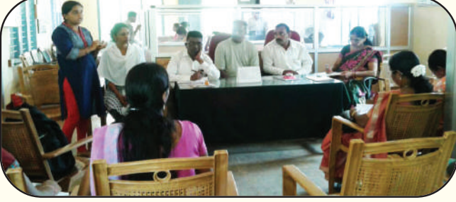
ನಾಗರಿಕ ಸೌಕರ್ಯ ಸಮಿತಿಗೆ ತರಬೇತಿ:

ಅವರ ಹಕ್ಕು ಮತ್ತು ಕರ್ತವ್ಯಗಳ ಬಗ್ಗೆ ತರಬೇತಿ ಕಾರ್ಯಕ್ರಮಗಳನ್ನು ಹಮ್ಮಿಕೊಳ್ಳಲಾಯಿತು ಮತ್ತು ಯೋಜನಾ ವ್ಯಾಪ್ತಿಯ ಪಂಚಾಯತು ಸದಸ್ಯರಿಗೆ ತರಬೇತಿ ನೀಡುವುದರೊಂದಿಗೆ ಅವರ ಮೂಲಕ ಶಾಲೆಗಳ ಮೇಲ್ವಿಚಾರಣೆ ನಡೆಸುವುದು, ಸ್ಥಳೀಯ ಸರ್ಕಾರದ ಪಾತ್ರವನ್ನು ಮನದಟ್ಟು ಮಾಡಲಾಯಿತು.