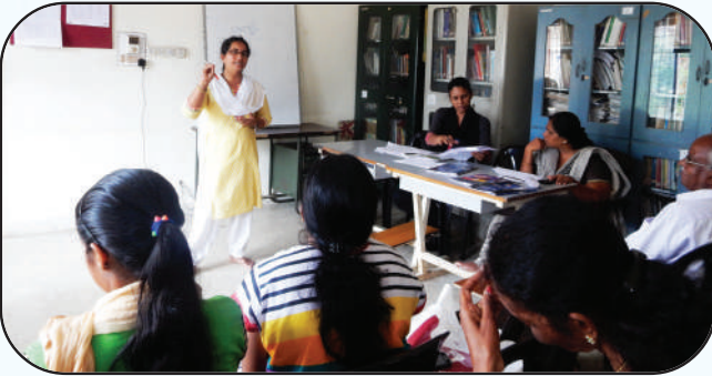
ತರಬೇತುದಾರರಿಂದ ವಿಷಯ ಮಂಡನೆ ಮತ್ತು ಮೌಲ್ಯಮಾಪನ

ಉಡುಪಿ ಮತ್ತು ದ.ಕ ಜಿಲ್ಲೆಯ ಶಿಕ್ಷಣ ಸಂಪನ್ಮೂಲ ಕೇಂದ್ರದ ತರಬೇತುದಾರರ ಮೌಲ್ಯಮಾಪನ ನಡೆಸಲಾಯಿತು. ನವಂಬರ್ 27ರಂದು ಜಿಲ್ಲಾ ಶಿಕ್ಷಣ ಸಂಪನ್ಮೂಲ ಕೇಂದ್ರ ಉಡುಪಿಯ ಸಭಾಂಗಣದಲ್ಲಿ ಮತ್ತು ನವಂಬರ್ 28ರಂದು ಪಡಿ ಸಂಸ್ಥೆ ಮಂಗಳೂರು ಇಲ್ಲಿಯ ಸಭಾಂಗಣದಲ್ಲಿ ನಡೆಯಿತು. ಒಟ್ಟು 60. ಸಂಪನ್ಮೂಲ ವ್ಯಕ್ತಿಗಳು ತಾವು ಪಡೆದುಕೊಂಡ ವಿಷಯವಾರು ತರಬೇತಿಯನ್ನಯ ವಿಷಯ ಮಂಡನೆ ಮಾಡಲಾಯಿತು. ಮೌಲ್ಯಮಾಪನ ಪ್ರಕ್ರಿಯೆಯಲ್ಲಿ 10 ಮಾನದಂಡಗಳನ್ನೊಳಗೊಂಡಂತೆ ಸಂಪನ್ಮೂಲ ವ್ಯಕ್ತಿಗಳನ್ನು ವಿಶ್ಲೇಷಣೆ ಮಾಡಲಾಯಿತು. ವಿಷಯ ಮಂಡನೆ ಮೂಲಕ