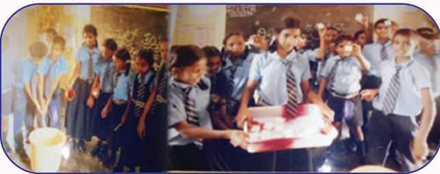
ಮಕ್ಕಳಿಂದ ಫಿನಾಯಿಲ್ ಮತ್ತು ಸೋಪ್ ತಯಾರಿಕೆ

ಮನಸ್ಸು ಮತ್ತು ಸಾಧಿಸುವ ಛಲವೊಂದಿದ್ದರೆ ಏನನ್ನಾದರೂ ಸಾಧಿಸಬಹುದು ಎಂಬುದಕ್ಕೆ ಸ್ಪಷ್ಟ ಉದಾಹರಣೆಯೆಂದರೆ ಸರಕಾರಿ ಹಿರಿಯ ಪ್ರಾಥಮಿಕ ಶಾಲೆ ಅರ್ಕ ಇಲ್ಲಿನ ಮಕ್ಕಳು. ಈ ಶಾಲೆಯ ಮೀನಾ ಮಕ್ಕಳ ಹಕ್ಕುಗಳ ಸಂಘದ ಮಕ್ಕಳು ಹಾಗೂ ಶಿಕ್ಷಕರ ಮಾರ್ಗದರ್ಶನದಲ್ಲಿ ಬದುಕಿನ ಸ್ವಾವಲಂಬನೆ ಕಲಿಕೆಯಲ್ಲಿ ತಮ್ಮನ್ನು ತೊಡಗಿಸಿಕೊಂಡಿದ್ದಾರೆ. ನಿತ್ಯ ಜೀವನದಲ್ಲಿ ಬರುವ ನಾನಾ ರೀತಿಯ ಸಾಂಕ್ರಾಮಿಕ ರೋಗಗಳಿಗೆ ಕೈ ತೊಳೆಯದೆ ಆಹಾರ ಸೇವನೆ ಮಾಡುವುದು ಮುಖ್ಯ ಕಾರಣವಾಗಿದ್ದು ಈ ಬಗ್ಗೆ ಶಾಲಾ ಮಕ್ಕಳಿಗೆ ಆರೋಗ್ಯ ಇಲಾಖೆಯಿಂದ ಮಾಹಿತಿ ನೀಡಲಾಯಿತು. ಹಾಗೂ ತೊಳೆಯುವ ವಿಧಾನಗಳನ್ನು ತಿಳಿಸಲಾಯಿತು. ಇದನ್ನು ಪ್ರತಿನಿತ್ಯ ಶಾಲೆಯಲ್ಲಿ ಅನುಸರಿಸಲು ಮಕ್ಕಳಿಗೆ ಬೇಕಾಗುವ ಸೋಪ್ ಮತ್ತು ಶೌಚಾಲಯ ಸ್ವಚ್ಛಗೊಳಿಸುವುದಕ್ಕಾಗಿ ಫಿನಾಯಿಲ್ ತಯಾರಿಸುವ ಯೋಜನೆಯನ್ನು ಮಕ್ಕಳೆ ತಯಾರುಗೊಳಿಸಿದರು. ಹಾಗೂ ಶಿಕ್ಷಕರ ಮಾರ್ಗದರ್ಶನದಲ್ಲಿ ತರಬೇತಿಯನ್ನೂ ಪಡೆದುಕೊಂಡು ಮಕ್ಕಳೆ ಸೋಪ್ ಮತ್ತು ಫಿನಾಯಿಲ್ ತಯಾರಿಸಲು ಮುಂದಾಗಿರುವುದು ಮಾತ್ರವಲ್ಲ ಪ್ರತೀ 15 ದಿನಗಳಿಗೊಮ್ಮೆ ಶಾಲೆಯಲ್ಲಿಯೇ ಎಲ್ಲಾ ಮಕ್ಕಳು ಸೇರಿಕೊಂಡು ಸೋಪು ಮತ್ತು ಫಿನಾಯಿಲ್ ತಯಾರಿಸುತ್ತಾರೆ. ಈ ಮಕ್ಕಳು ಶಾಲೆಗೆ ಮಾದರಿಯಾಗಿದ್ದಾರೆ.