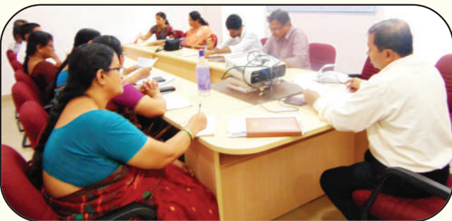
ಡಯಟ್‌ನ ಉಪನ್ಯಾಸಕರೊಂದಿಗೆ ಸಮಾಲೋಚನೆ

‘ಪಡಿ’ಯ ಯೋಜನಾ ವ್ಯಾಪ್ತಿಯ ಮಗು ಸ್ನೇಹಿ ಶಾಲೆಯ ಪ್ರಗತಿ ಪರಿಶೀಲನೆ ಕುರಿತಂತೆ ಡಯಟ್‌ನೊಂದಿಗೆ ಮೌಲ್ಯಮಾಪನ ಮಾಡಿದ ನಂತರ ಕಂಡುಕೊಂಡ ಅಂಶಗಳನ್ನು ಕಾರ್ಯರೂಪಕ್ಕೆ ತರುವ ನಿಟ್ಟಿನಲ್ಲಿ ಸಾಧ್ಯ ಸಾಧ್ಯತೆಗಳ ಕುರಿತು 16.07.2016 ರಂದು ಡಯಟ್ ಸಭಾಂಗಣದಲ್ಲಿ ಚರ್ಚಿಸಲಾಯಿತು. ಸಭೆಯಲ್ಲಿ ಡಯಟ್‌ನ ಪ್ರಾಂಶುಪಾಲರು ಮತ್ತು ಉಪನ್ಯಾಸಕ ವೃಂದದವರು ಉಪಸ್ಥಿತರಿದ್ದರು ಮತ್ತು ಶಾಲೆಗಳಲ್ಲಿ ಭೇಟಿ ನೀಡಿದ ಸಂದರ್ಭದಲ್ಲಿ ಕಂಡುಕೊಂಡ ವಿಚಾರಗಳು ಮತ್ತು ಸಮಸ್ಯೆಗಳನ್ನು ಚರ್ಚಿಸಲಾಯಿತು ಅಲ್ಲದೇ ಮಗು ಸ್ನೇಹಿ ವಾತಾವರಣ ನಿರ್ಮಾಣ ಮಾಡುವಲ್ಲಿ ಪಡಿಯ ಕಾರ್ಯ ಚಟುವಟಿಕೆಗಳಿಗೆ ಸಹಕಾರ ಮತ್ತು ಸಹಯೋಗ ನೀಡುವ ಕುರಿತು ಚರ್ಚಿಸಲಾಯಿತು.