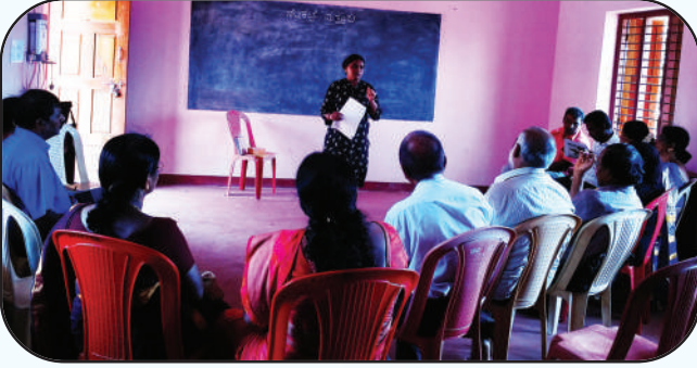
ಒಕ್ಕೂಟಗಳಿಗೆ ಸಾಮರ್ಥ್ಯ ಅಭಿವೃದ್ಧಿ ತರಬೇತಿ

ಶಿಕ್ಷಣ ಸಂಪನ್ಮೂಲ ಕೇಂದ್ರಗಳ ಮೇಲ್ವಿಚಾರಣೆ ಮಾಡುವ ಬಗ್ಗೆ ತರಬೇತಿ ಜಿಲ್ಲಾ ಶಿಕ್ಷಣ ಸಂಪನ್ಮೂಲ ಕೇಂದ್ರಗಳನ್ನು ಆಡಳಿತಾತ್ಮಕವಾಗಿ ಸದೃಶರಾಗಿ ಬೆಳೆಯುವಲ್ಲಿ ಯೋಜನೆಯನ್ನು ಕೈಗೆತ್ತಿಕೊಳ್ಳುವುದರ ಜತೆಗೆ ಸಂಪನ್ಮೂಲ ಕ್ರೂಢಿಕರಣದ ಕುರಿತಾಗಿ ತರಬೇತಿ ನೀಡಲಾಯಿತು.