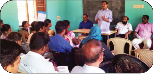
ಮಧ್ಯ ಸಮೂಹ ಸಂಪನ್ಮೂಲ ಕೇಂದ್ರದಲ್ಲಿ ಸಮಾಲೋಚನಾ ಸಭೆ

ಬಂಟ್ವಾಳ ತಾಲೂಕಿನ ಮಧ್ಯ ಕ್ಷಸ್ಥರನ್ನು ಮಾದರಿ ಸಮೂಹ ಸಂಪನ್ಮೂಲ ಕೇಂದ್ರವನ್ನಾಗಿ ರೂಪಿಸುವ ನಿಟ್ಟಿನಲ್ಲಿ ಇಲಾಖೆಗಳೊಂದಿಗೆ ಸಮಾಲೋಚನಾ ಸಭೆಯನ್ನು ನಡೆಸಲಾಯಿತು. ಮಧ್ಯ ಸಮೂಹ ಸಂಪನ್ಮೂಲ ಕೇಂದ್ರ ವ್ಯಾಪ್ತಿಯ ಎಲ್ಲಾ ಶಾಲೆಗಳ ಎಸ್.ಡಿ.ಎಮ್.ಸಿ ಗಳಿಗೆ ತರಬೇತಿ ನೀಡಲಾಯಿತು. ಮಗುಸ್ನೇಹಿ ಶಾಲೆಯ ಸೂಚ್ಯಂಕದ ಅನುಷ್ಠಾನ ತಮ್ಮ ಶಾಲೆಗಳಲ್ಲಿ ನಡೆಸುವ ಕುರಿತಂತೆ ತರಬೇತಿ ನೀಡಲಾಯಿತು. ಮಧ್ಯ ಸಮೂಹ ಸಂಪನ್ಮೂಲ ಕೇಂದ್ರದಲ್ಲಿ ಹೋಬಳಿ ಮಟ್ಟದಲ್ಲಿ ಎಸ್.ಡಿ.ಎಮ್.ಸಿ ಸಮನ್ವಯ ಸಮಿತಿ ರಚನೆ ಮತ್ತು ಅದರ ಕರ್ತವ್ಯಗಳ ತರಬೇತಿ ನೀಡಲಾಯಿತು.