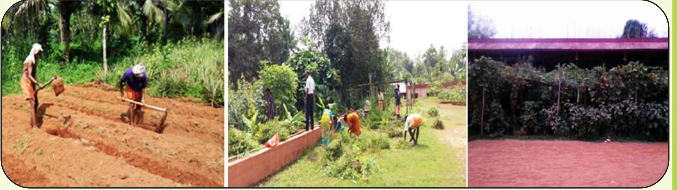
ಎಸ್.ಡಿ.ಎಮ್.ಸಿ. ಮತ್ತು ಹೆತ್ತವರಿಂದ ಶಾಲಾ ಕೈತೋಟಕ್ಕೆ ಶ್ರಮದಾನ

ನೀಡಲಾಯಿತು. ಅದರಂತೆ ಪೋಷಕರು ತಮ್ಮ ಸಭೆಗಳಲ್ಲಿ ಕೈತೋಟ ರಚಿಸಲು ನಿರ್ಣಯ ಕೈಗೊಂಡರು ಮತ್ತು ತಮ್ಮ ಬಿಡುವಿನ ಸಮಯವನ್ನು ಶಾಲೆಗಳಿಗೆ ಬಳಕೆ ಮಾಡಿದ ಪೋಷಕರು ತಮ್ಮ ರಜಾದಿನಗಳಲ್ಲಿ ಶಾಲೆಯಲ್ಲಿ ಕೈತೋಟ ರಚಿಸುವಲ್ಲಿ ಕಾರ್ಯಪ್ರವೃತ್ತರಾದರು. ಈ ಬಗ್ಗೆ ತಮ್ಮ ಶಾಲಾ ಮಕ್ಕಳಿಗೆ ಕೂಡ “ಜೀವನ ಪಾಠ” ಕೃಷಿಯ ಬಗ್ಗೆ ಮನವರಿಕೆ ಮಾಡಿಸಿದರು. ಹಲವಾರು ರೀತಿಯ ಸೊಪ್ಪು ತರಕಾರಿಗಳನ್ನು ಶಾಲಾ ವತಾರದಲ್ಲಿ ಬೆಳೆಸಿದರು. ಮಕ್ಕಳಿಗೆ ಉತ್ತಮ ಪೌಷ್ಟಿಕಾಂಶಯುಕ್ತ ಆಹಾರ ಲಭಿಸುವಂತಾಯಿತು. ಮಕ್ಕಳಿಗೆ ಕೃಷಿಯ ಬಗ್ಗೆ ಆಸಕ್ತಿ ಮೂಡಿತು.