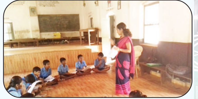
ಮೀನಾ ಮತ್ತು ಮಕ್ಕಳ ಹಕ್ಕುಗಳ ಕ್ಲಬ್‌ಗಳೊಂದಿಗೆ ಸಮಾಲೋಚನಾ ಸಭೆ

ಉಡುಪಿ ಮತ್ತು ದ.ಕ ಜಿಲ್ಲೆಯ ಯೋಜನಾ ವ್ಯಾಪ್ತಿಯ 24 ಶಾಲೆಗಳ ಮಕ್ಕಳ ಹಕ್ಕುಗಳ ಕ್ಲಬ್ ಮತ್ತು ಮೀನಾ ಕ್ಲಬ್‌ನ ಸದಸ್ಯರನ್ನೊಳಗೊಂಡಂತೆ ಸಮಾಲೋಚನಾ ಸಭೆಯನ್ನು ನಡೆಸಿ ಮಕ್ಕಳ ಹಕ್ಕುಗಳ ಕ್ಲಬ್‌ಗಳು ಮತ್ತು ಮೀನಾ ಕ್ಲಬ್‌ಗಳು ಪರಿಣಾಮಕಾರಿಯಾಗಿ ಕಾರ್ಯ ನಿರ್ವಹಿಸುವ ಕುರಿತಂತೆ ಚರ್ಚಿಸಲಾಯಿತು. ಮಕ್ಕಳ ಸರ್ವತೋಮುಖ ಅಭಿವೃದ್ಧಿಯ ನಿಟ್ಟಿನಲ್ಲಿ ಮಕ್ಕಳ ಈ ಕ್ಲಬ್‌ಗಳು ನಿರಂತರವಾಗಿ ಚಟುವಟಿಕೆಯಿಂದ ಇರಲು ಪೂರಕವಾಗುವಂತೆ ಮಕ್ಕಳಲ್ಲಿ ಅರಿವನ್ನು ಮೂಡಿಸಲಾಯಿತು.