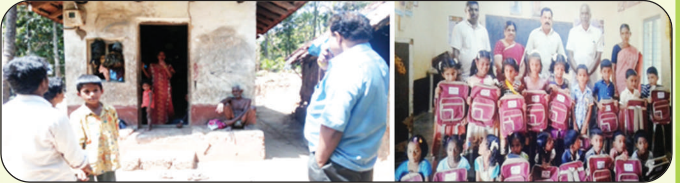
ಎಸ್.ಡಿ.ಎಮ್.ಸಿ.ಯಿಂದ ಮನೆ ಭೇಟಿ ಮತ್ತು ಪುಸ್ತಕ ವಿತರಣೆ

ಸರಕಾರಿ ಶಾಲೆಗಳ ಒಂದು ಮೂಲಭೂತ ಸಮಸ್ಯೆ ಎಂದರೆ ಮಕ್ಕಳ ಕೊರತೆ, ಈ ಸಮಸ್ಯೆಗೆ ಎಸ್.ಡಿ.ಎಮ್.ಸಿಗಳು ದಾಖಲಾತಿ ಆಂದೋಲನ ಮಾಡಲು ಮತ್ತು ತಮ್ಮ ಶಾಲೆಗೆ ಮಕ್ಕಳ ದಾಖಲಾತಿ ಹೆಚ್ಚಿಸಲು ಅನೇಕ ಕಾರ್ಯಕ್ರಮಗಳನ್ನು ಹಮ್ಮಿಕೊಂಡಿದೆ. ಅವುಗಳಲ್ಲಿ ಮುಖ್ಯವಾಗಿ ಶಾಲೆ ಕಡೆ ನನ್ನ ನಡೆ ಕಾರ್ಯಕ್ರಮಗಳ ಮೂಲಕ ಮತ್ತು ಸರಕಾರಿ ಶಾಲೆಗಳಲ್ಲಿ ಸಿಗುವ ಸೌಲಭ್ಯಗಳ ಕರಪತ್ರಗಳ ಮೂಲಕ ಹೆತ್ತವರ ಭೇಟಿ ಮತ್ತು ಮಕ್ಕಳ ಕಲಿಕೆ ಪೂರಕವಾಗಿ ಬೇಕಾಗುವ ಸೌಲಭ್ಯಗಳನ್ನು ದೊರಕಿಸಿ ಕೊಡುವಲ್ಲಿ ಸಾಕಷ್ಟು ಪ್ರಯತ್ನವನ್ನು ಮಾಡಿರುತ್ತಾರೆ.