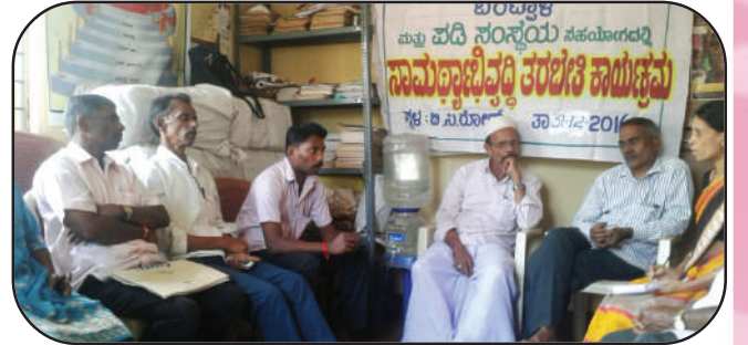
ಶಿಕ್ಷಣ ಸಂಪನ್ಮೂಲ ಕೇಂದ್ರಗಳಿಗೆ ಸಾಮರ್ಥ್ಯ ಅಭಿವೃದ್ಧಿ ತರಬೇತಿ

ಈ ಕಾರ್ಯಾಗಾರದಲ್ಲಿ ಶಿಕ್ಷಣ ಸಂಪನ್ಮೂಲ ಕೇಂದ್ರಗಳ ಬಲ ವರ್ಧನೆಯನ್ನು ಹೇಗೆ ಮಾಡಬಹುದು ಮತ್ತು ಸ್ವ ಅವಲಂಬಿತರಾಗಿ ತನ್ನ ಕಾರ್ಯಕ್ರಮಗಳನ್ನು ಮುನ್ನಡೆಸಿಕೊಂಡು ಹೋಗಬೇಕಾದ ನಿಟ್ಟಿನಲ್ಲಿ ಪೂರ್ವ ಯೋಜನೆಯನ್ನು ಮತ್ತು ಆಡಳಿತಾತ್ಮಕವಾಗಿ ಸದೃಢವಾಗಿ ಬೆಳೆಯುವಲ್ಲಿ ಯೋಜನೆಯನ್ನು ರೂಪಿಸಲು ಚರ್ಚೆಯನ್ನು ನಡೆಸಲಾಯಿತು.