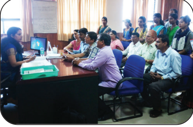
ಜಿಲ್ಲಾ ಪಂಚಾಯತಿನ ಮುಖ್ಯ ಕಾರ್ಯನಿರ್ವಹಣಾಧಿಕಾರಿಯವರಿಗೆ ಮನವಿ