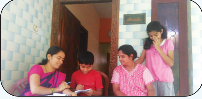
ಆಸರ್ ಮಕ್ಕಳ ಸಮೀಕ್ಷೆ

ತರಬೇತಿಯನ್ನು ನೀಡುವುದರ ಜತೆಗೆ ದ.ಕ ಮತ್ತು ಉಡುಪಿ ಜಿಲ್ಲೆಯ ಆಯ್ದು 30 ಹಳ್ಳಿಗಳ ಮಕ್ಕಳ ಶೈಕ್ಷಣಿಕ ಸ್ಥಿತಿಗತಿಗಳ ವಾರ್ಷಿಕ ವರದಿಯನ್ನು ಶಿಕ್ಷಣ ಸಂಪನ್ಮೂಲ ಕೇಂದ್ರಗಳ ಸಹಕಾರದೊಂದಿಗೆ ನಡೆಸಿ ಜಿಲ್ಲಾ ಮಟ್ಟದ ವರದಿಯನ್ನು ಅಸರ್ ಸಂಸ್ಥೆಗೆ ಕಳುಹಿಸಿಕೊಡಲಾಯಿತು.