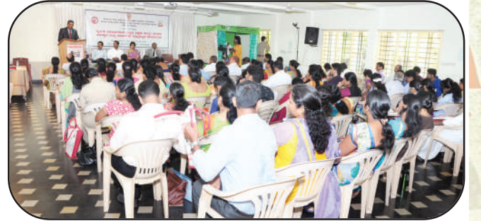
ಪೋಕ್ಸೋ ರಾಜ್ಯಮಟ್ಟದ ತರಬೇತಿ ಕಾರ್ಯಾಗಾರ