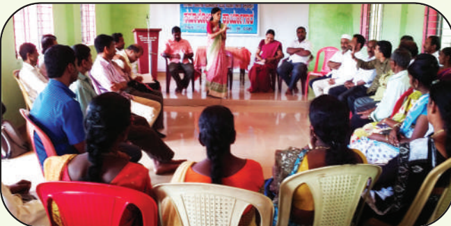
ಗ್ರಾಮ ಮತ್ತು ತಾಲೂಕು ಮಟ್ಟದ ಎಸ್.ಡಿ.ಎಮ್.ಸಿ ಸಮನ್ವಯ ಸಮಿತಿ ರಚನೆ ಮತ್ತು ಸಮಾಲೋಚನಾ ಸಭೆ

ಎಸ್.ಡಿ.ಎಮ್.ಸಿ ಸಮನ್ವಯ ಸಮಿತಿಗಳು ರಾಜ್ಯ ಮಟ್ಟದಲ್ಲಿ ಅಸ್ತಿತ್ವದಲ್ಲಿದ್ದು, ಈ ಸಮಿತಿಗಳ ರಚನೆಯನ್ನು ತಳಮಟ್ಟದಲ್ಲಿ ನಡೆಸುವ ನಿಟ್ಟಿನಲ್ಲಿ 'ಪಡಿ'ಯು ಶಿಕ್ಷಣ ಸಂಪನ್ಮೂಲಗಳ ಕೇಂದ್ರಗಳ ಸಹಕಾರದೊಂದಿಗೆ ಜಿಲ್ಲಾ ಮಟ್ಟ ಮತ್ತು ತಾಲೂಕು ಮಟ್ಟದಲ್ಲಿ ಸಮಿತಿಗಳು ರಚನೆಯಾಗಿದ್ದು ಅವುಗಳ ವಿಸ್ತರಣೆಯನ್ನು ಗ್ರಾಮ ಮಟ್ಟಕ್ಕೆ ಪಸರಿಸುವ ನಿಟ್ಟಿನಲ್ಲಿ ಗ್ರಾಮ ಮಟ್ಟದಲ್ಲಿ ಎಸ್.ಡಿ.ಎಮ್.ಸಿ ಸದಸ್ಯರ ಸಮಿತಿಯ ರಚನಾ ಪ್ರಕ್ರಿಯೆಯು ನಡೆಯುತ್ತಾ ಇದ್ದು ಈಗಾಗಲೇ ಉಡುಪಿಯಲ್ಲಿ 8 ಮತ್ತು ದ.ಕ ಜಿಲ್ಲೆಯ 60 ಗ್ರಾಮ ಪಂಚಾಯತುಗಳಲ್ಲಿ ಎಸ್.ಡಿ.ಎಮ್.ಸಿ ರಾಜ್ಯ ಸಮನ್ವಯ ಸಮಿತಿಯ ಬೈಲಾ ಪ್ರಕಾರ ರಚನೆಯಾಗಿದ್ದು ಅವರಿಗೆ ಈ ಸಮಿತಿಯ ಕುರಿತಂತೆ ಓರಿಯಂಟೇಷನ್ (ತಿಳುವಳಿಕಾ ಕಾರ್ಯಕ್ರಮ) ನೀಡಲಾಗಿದೆ.