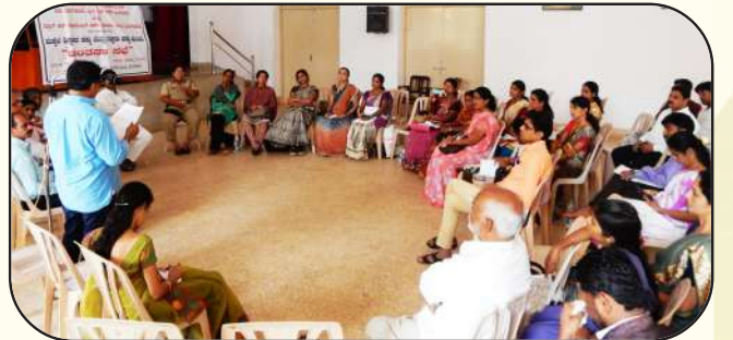
ಶಿಕ್ಷಣ ಹಕ್ಕು ಕಾಯಿದೆಯ ಪರಿಣಾಮಕಾರಿ ಅನುಷ್ಠಾನಕ್ಕಾಗಿ ಚಿಂತನಾ ಸಭೆ

ಪಡಿ ಮಂಗಳೂರು ಮತ್ತು ಶಿಕ್ಷಣ ಸಂಪನ್ಮೂಲ ಕೇಂದ್ರಗಳ ಒಕ್ಕೂಟ(ರಿ) ದ.ಕ ಮತ್ತು ಚೈಲ್ಡ್‌ಲೈನ್ ಮಂಗಳೂರು ಮತ್ತು ಸ್ಕೂಲ್ ಆಪ್ ಸೋಶಿಯಲ್ ವರ್ಕ್, ರೋಶನಿ ನಿಲಯ ಇವರ ಸಹಯೋಗದೊಂದಿಗೆ ಶಿಕ್ಷಣ ಹಕ್ಕು ಕೋಶ ಮತ್ತು ಮಕ್ಕಳ ಸುರಕ್ಷತೆ ಕುರಿತಂತೆ ಚಿಂತನಾ ಸಭೆಯನ್ನು ದಿನಾಂಕ 30.06.2016ರಂದು ರೋಶನಿ ನಿಲಯದಲ್ಲಿ ನಡೆಯಿತು. ಸಭೆಯಲ್ಲಿ