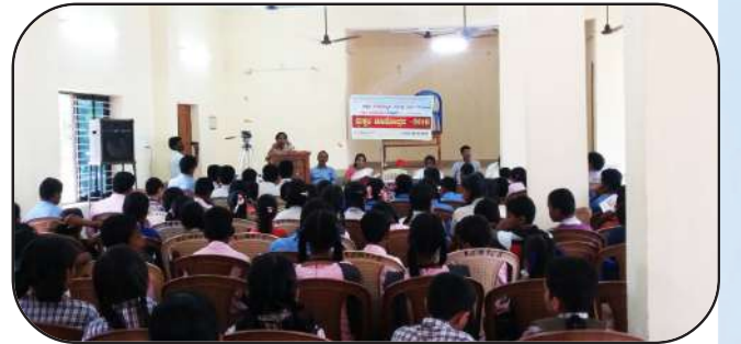
ಮಕ್ಕಳ ಮಾಸೋತ್ಸವದ ಅಂಗವಾಗಿ ಅರಿವು ಕಾರ್ಯಕ್ರಮ

ಮಕ್ಕಳ ಮಾಸೋತ್ಸವ ಕಾರ್ಯಕ್ರಮವನ್ನು ಶಿಕ್ಷಣ ಸಂಪನ್ಮೂಲ ಕೇಂದ್ರವು ಕಳೆದ 10 ವರ್ಷಗಳಿಂದ ನಿರಂತರವಾಗಿ ಮಾಡುತ್ತಾ ಬರುತ್ತಿದ್ದು ಈ ಕಾರ್ಯಕ್ರಮವು ಒಂದು ತಿಂಗಳ ನಿರಂತರ ಕಾರ್ಯಕ್ರಮವಾಗಿದ್ದು ಉಡುಪಿ ಮತ್ತು ದ.ಕ ಜಿಲ್ಲೆಯ ವಿವಿಧ ಕಡೆಗಳಲ್ಲಿ ಮಕ್ಕಳ ಹಕ್ಕುಗಳಿಗೆ ಸಂಬಂಧಿಸಿದ ವಿಷಯದ ಕುರಿತು ಅರಿವು ಮೂಡಿಸುವ ವಿಭಿನ್ನ ಕಾರ್ಯಕ್ರಮವನ್ನು ಮಾಡಲಾಗುತ್ತಿದೆ. 2016 ಸಾಲಿನಲ್ಲಿ ಉಡುಪಿಯಲ್ಲಿ ಪೋಕ್ಸೋ ಕಾಯಿದೆಯ ಕುರಿತಂತೆ 36 ಕಡೆಗಳಲ್ಲಿ ವಿವಿಧ ಗುಂಪುಗಳಿಗೆ ತರಬೇತಿಯನ್ನು ನೀಡಲಾಗಿದೆ. ಹಾಗೆಯೇ ದ.ಕ ಜಿಲ್ಲೆಯಲ್ಲೂ ಮಕ್ಕಳ ರಕ್ಷಣಾ ನೀತಿ-2016ರ ಕುರಿತಂತೆ ಅರಿವು ಕಾರ್ಯಕ್ರಮಗಳನ್ನು 25 ಕಡೆಗಳಲ್ಲಿ ನೀಡಲಾಗಿದೆ.