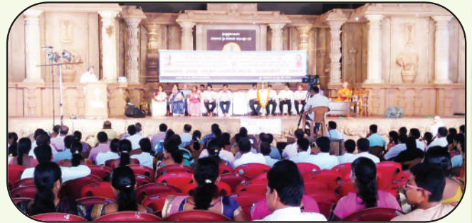
ಎಸ್.ಡಿ.ಎಮ್.ಸಿ ರಾಜ್ಯಮಟ್ಟದ ಸಮಾವೇಶ